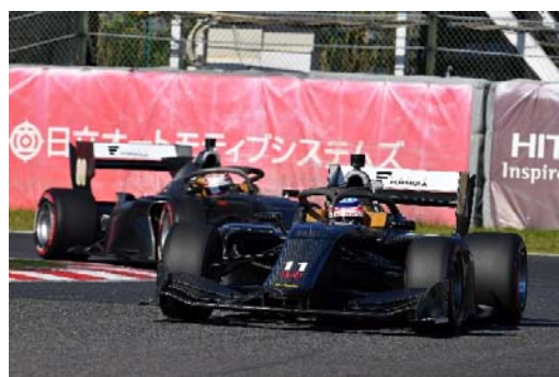
新型マシン SF19 によるテスト走行の様子