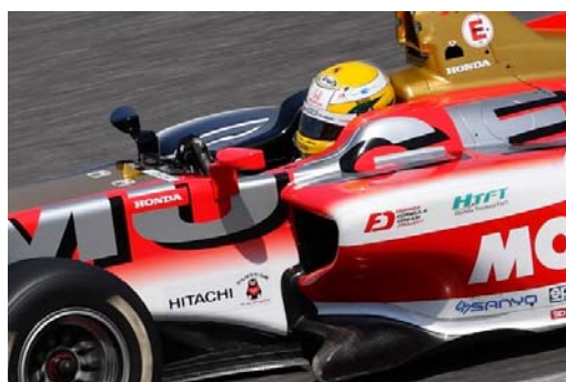
2018年シーズンのチャンピオンシップを獲得したマシン

日立オートモティブシステムズは今後も、全日本スーパーフォーミュラ選手権シリーズをはじめとしたモータースポーツへのスポンサーシップを通じて、日立ブランドのさらなる浸透を図ると共に、モータースポーツの振興に貢献していきます。